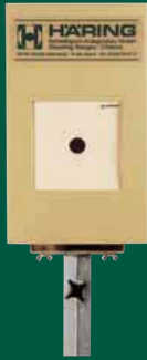
Elektronische Scheibenanlage 10 m ESA 10