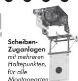
Scheiben- Zuganlagen mit mehreren Haltepunkten, für alle Montagearten

Postfach 1140 · D-35086 Battenberg Tel. (0 64 52) 93 32-0 · Fax: (0 64 52) 93 32-163 E-mail: info@johannsen.de Internet: www.johannsen.de