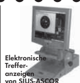
Elektronische Treffer- anzeigen von SIUS-ASCOR

Ein Begriff für perfekte Schießstand- technik