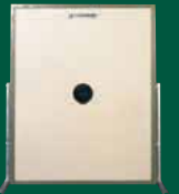
Elektronische Scheibenanlage 300 m ESA 300