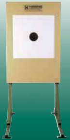
Elektronische Scheibenanlage 25/50/100 m ESA 25 ESA 50 und ESA 100