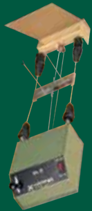
Scheibenzuganlage 10 m EL 3